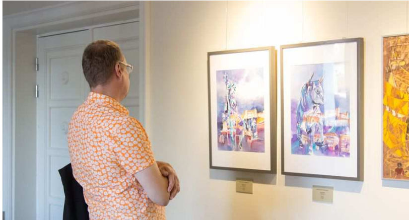
Salzburgi kunstnike näitus Sakala keskuses

Internet 6. August 2017 Printausgabe 7. August 2017