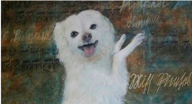
Fragment von der Ausstellung.

Am Freitag, um 14:00 Uhr wird im Sakala Zentrum die Kunstausstellung „Salzburg.Visionen“, gewidmet der Beziehungen zw. Estland und Österreich eröffnet.