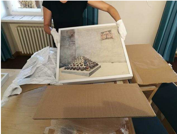
◀ Ankunft und Auspacken der Ausstellung im Sakala Zentrum

Das heutige Kulturzentrum hat eine interessante Geschichte – vor 100 Jahren war das unter dem Namen "Seasaare kõrts" bekannte Gebäude ein beliebter Vergnügungsort für Bauern, die in der Stadt ankamen oder sie verließen. Nach dem Krieg wurde das zerstörte Gebäude im Stil der stalinistischen Architektur wiederaufgebaut und es ist bis heute eines der besten Beispiele dieser Stilperiode der Stadt Viljandi.