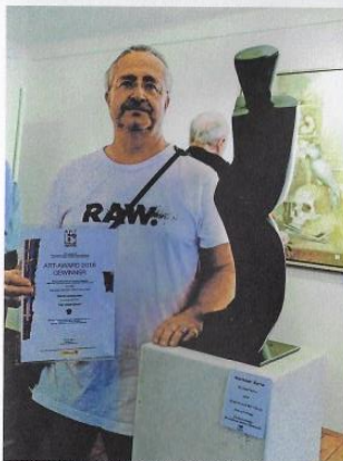
Martin Amerbauer, Skulptur MY DEATH FATHER

Weitere vier bestgereichte Künstler/innen (in alphabetischer Reihenfolge in der Kategorie Malerei und Grafik)