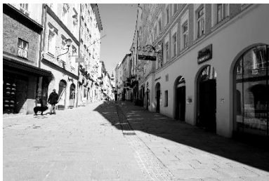
Elisabeth Weinek , "Shut down", 2020, S/W Fotografien, 30 x 40 cm

Weiteres tolles Bildmaterial und die Texte der KünstlerInnen zum Shutdown finden Sie als Download unter http://www.paulraas.com/pressedl/shutdownart-presse.zip