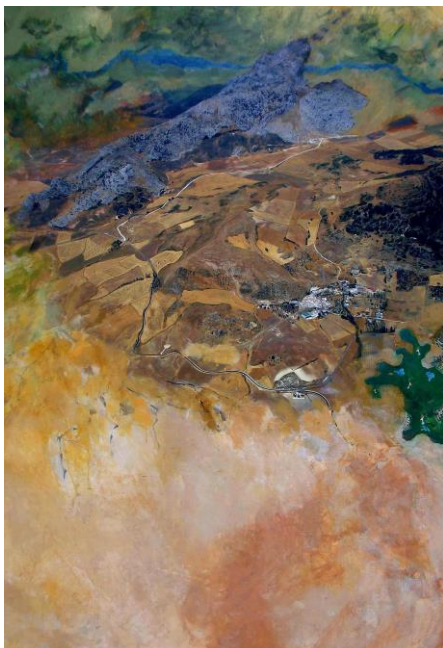
Jutta Brunsteiner, wüst fallen, 2011, Foto Acryl auf Leinwand, 203 x 141cm