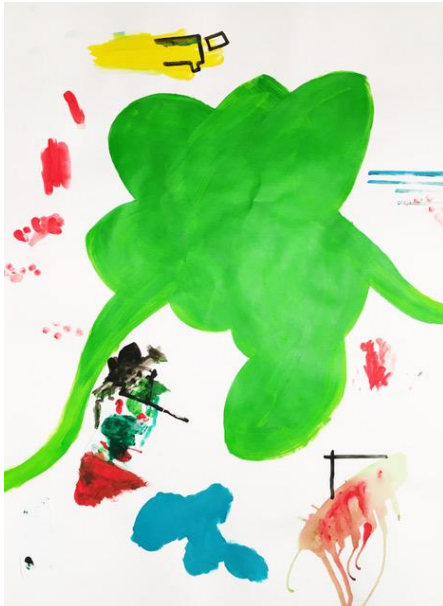
Paul Jaeg, Für einen Alltag (aus Bad Ischl), Werknummer FAIRBU-552, 2019, Acryl auf Karton, 80 x 110 cm