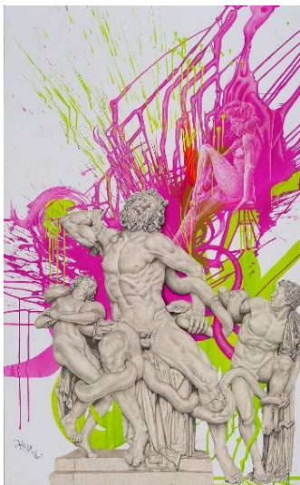
Das Aufbegehren gegen die Unerbittlichkeit des Schicksals

100 x 80 cm / Grafit, Pastell, Farbstift und Blattgold auf Hartfaserplatte / 2020